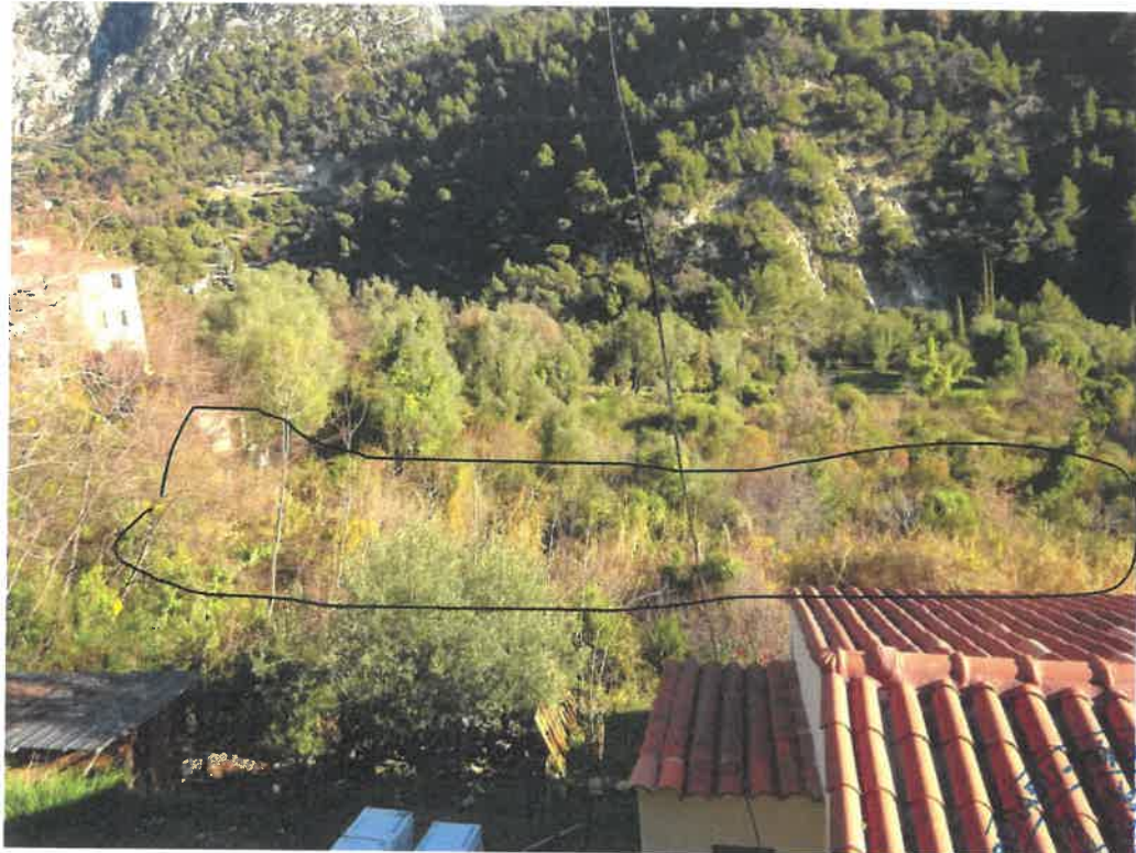
Vue des parcelles depuis le Sentier de Monti