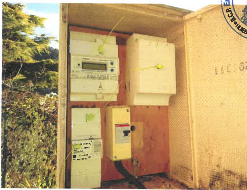
Compteur électrique en bordure du sentier de Monti